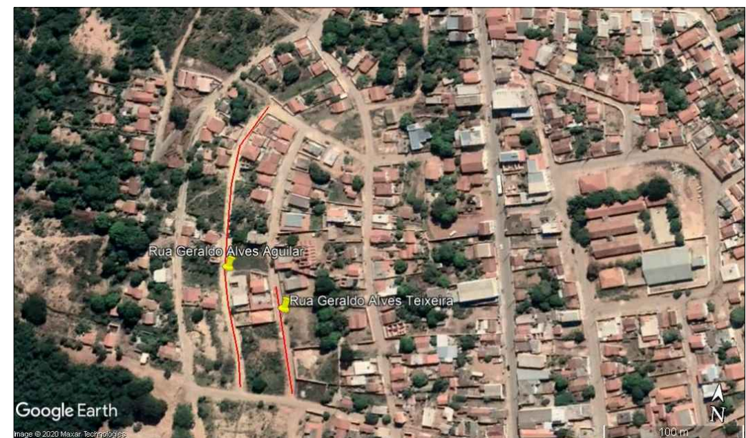
3 Rua Geraldo Alves Aguiar e Geraldo Alves Teixeira ESC.: S/ESC.